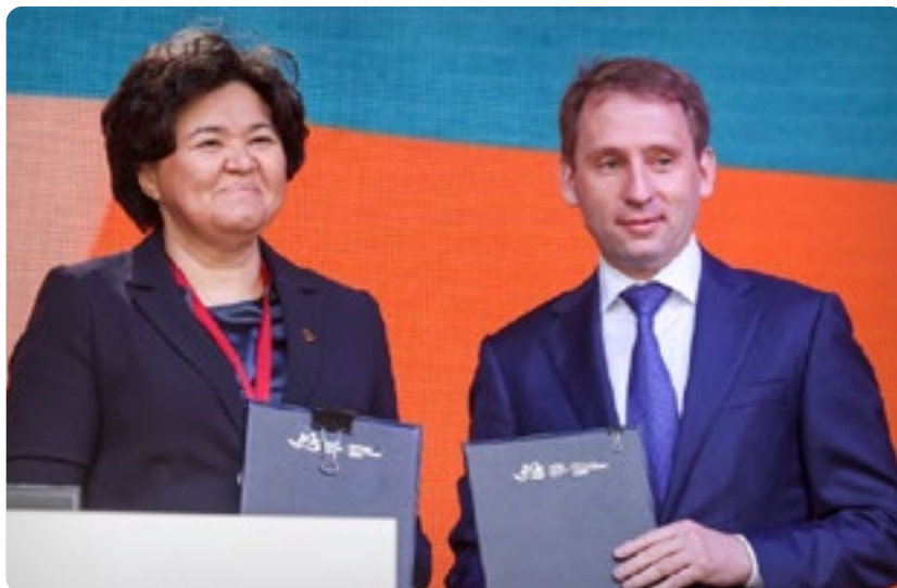
Viceminister Ecologie, Geologie en Natuurlijke Hulpbronnen van de Republiek van Kazachstan Aliya Shalabekova en minister van Natuurlijke Hulpbronnen en Ecologie van de Russische Federatie A.A. Kozlov