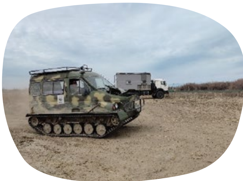
Rupsvoertuig geschikt voor moerassig terrein heeft ook veel onderhoud nodig wegens intensief gebruik