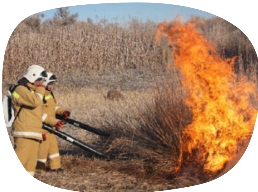
Bestrijding van rietbranden heeft grotere aandacht nodig