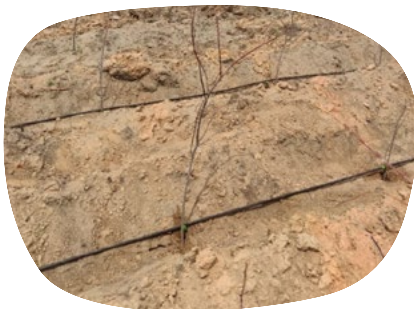
Druppelirrigatie draagt bij aan hogere overlevingskansen van de zaailingen