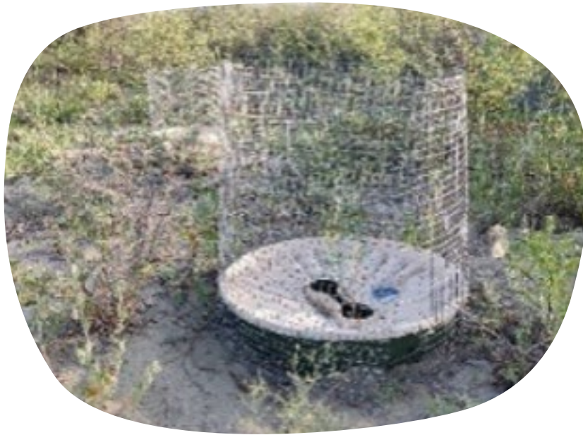
Individuele bescherming van zaailingen tegen vraat door konijnen