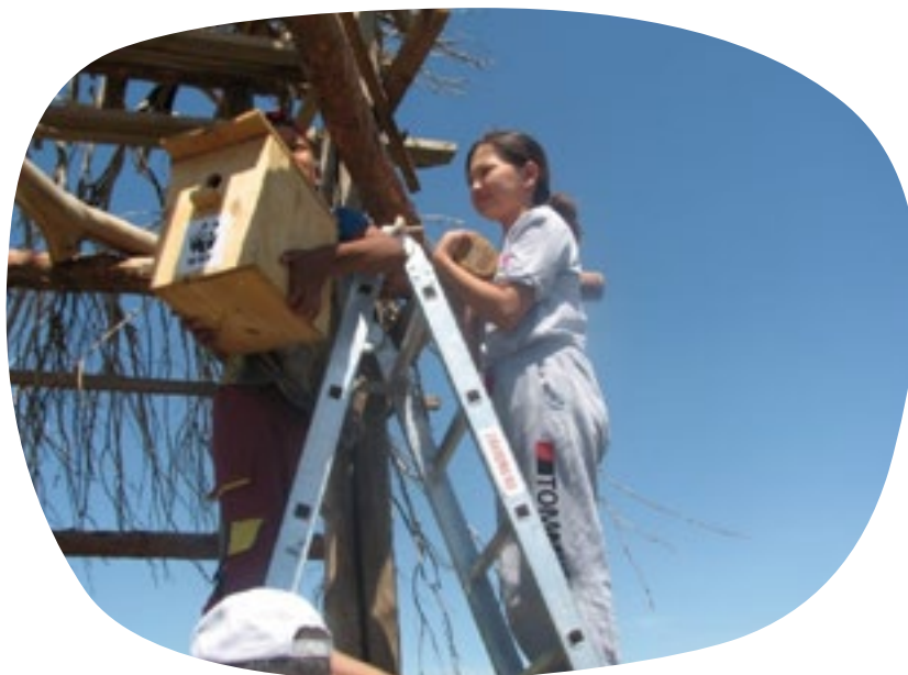
De kinderen van Karoy plaatsen nestgelegenheden voor een visarend