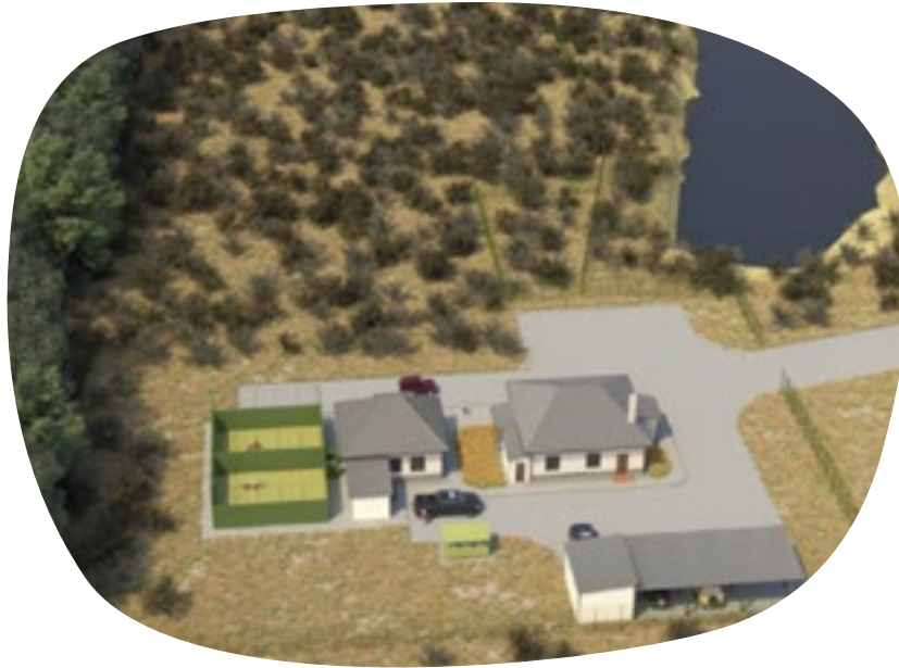
Artists impression van het tijger herintroductie centrum © WWF