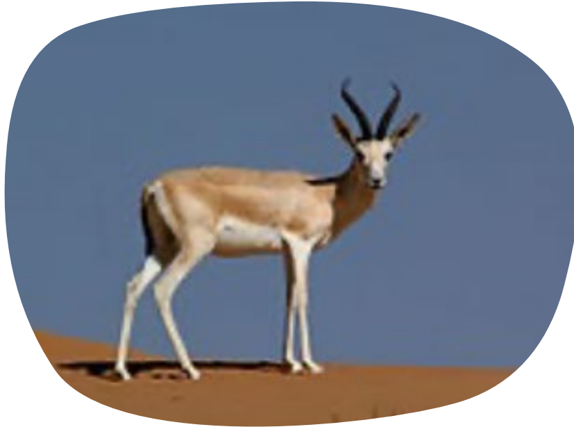
Kropgazelle, een centraal Aziatische soort die op de Rode Lijst als Kwetsbaar te boek staat en bescherming nodig heeft