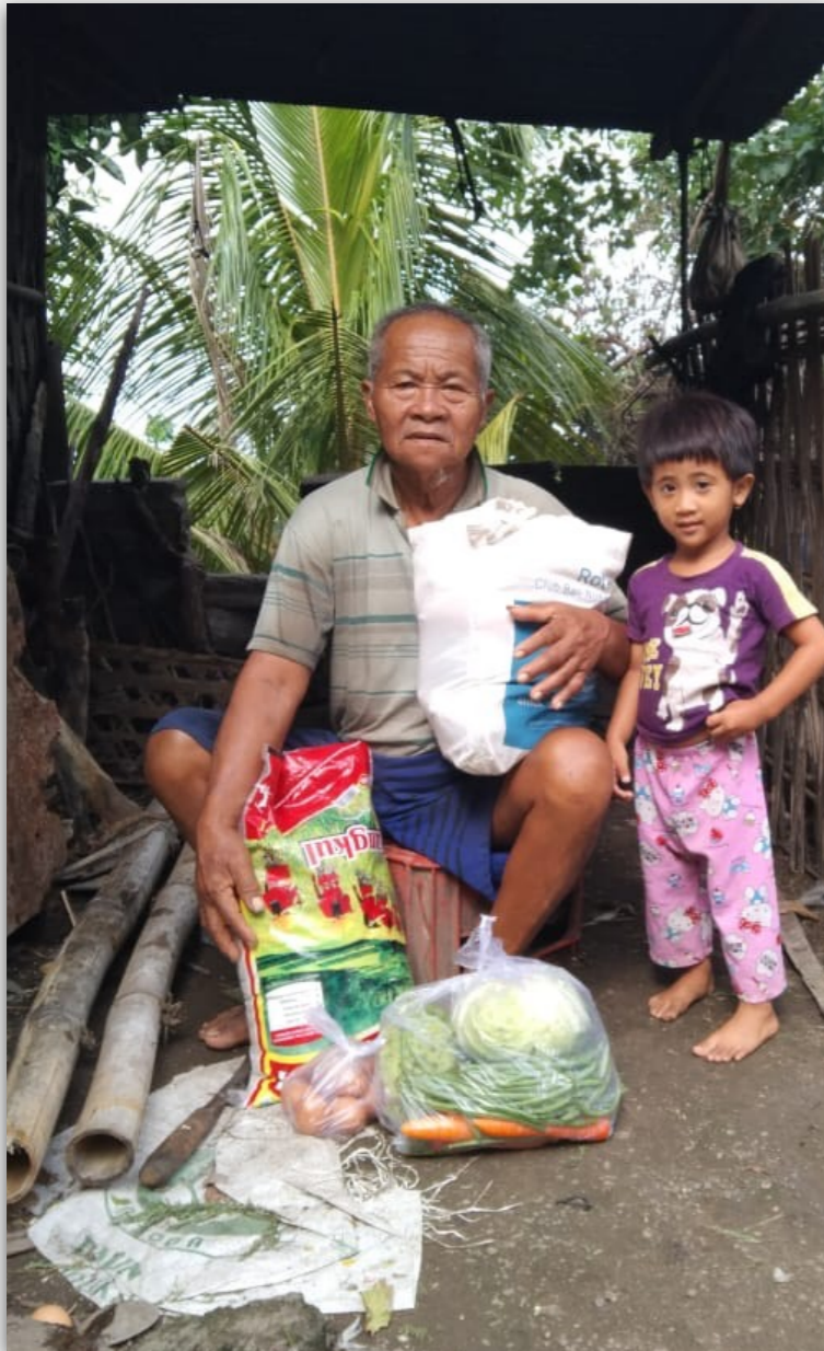
Een van de vele gezinnen die ondersteund worden

Toen in maart 2020 het corona-virus overal in de wereld opdook kwam het toerisme op Bali in ook helemaal tot stilstand. Veel mensen verloren hun baan en veel gezinnen, die ook voor de coronacrisis de eindjes maar net aan elkaar konden knopen, werden zwaar getroffen. Geen overheidssteun of financiële ondersteuning van familie. Een dag geen inkomen betekent een dag geen eten.